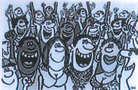
Ce début d'année structurante qui verra la n: