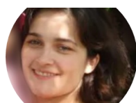
Stéphanie Gautrot Gestion. MO CPRIV